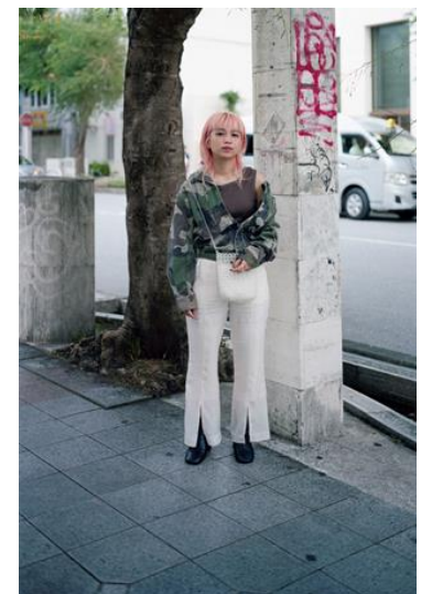
PUGMENT×ホンマタカシ 〈Images〉より 2019年 作家蔵 ©PUGMENT/©Takashi Homma

1962年、東京生まれ。写真集多数、著書に『たのしい写真 よい子のための写真教室』(平凡社、2009年)がある。近年の作品集に『THE NARCISSISTIC CITY』(MACK、2016年)、『TRAILS』(MACK、2019年)、『Looking Through: Le Corbusier Windows』(一般財団法人 窓研究所/カナダ建築センター/ヴァルター・ケーニッヒ、2020年)など。現在、東京造形大学大学院客員教授。