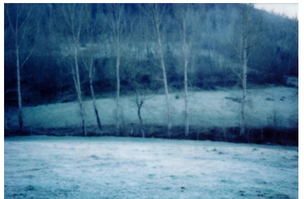
エレン・フライス《Ici-bas (In this lower world)》2019年 作家蔵 ©Elein Fleiss

1968年、フランス生まれ。1992年から2000年初頭にかけて、インディペンデントな編集方針によるファッション・カルチャー誌『Purple』を発行。2004年から2008年まで、個人的な視点にもとづくジャーナリズム誌『The Purple Journal』を発行した。現在はフランス南西部の田舎町を拠点に、写真や文章による作家活動を行っている。