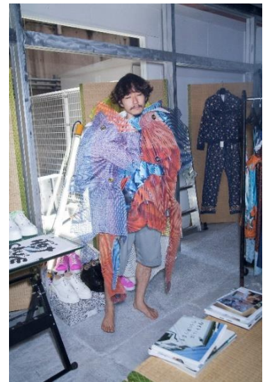
PUGMENT 〈Spring 2018〉より 2017年

2014年に東京で創設されたファッション・レーベル。人間の営みにおいて衣服の価値や意味が変容していくプロセスを観察し、衣服の制作工程に組み込む。ファッションにまつわるイメージと人との関係性に着目し、すでにある価値・環境・情報について別の視点を持つための衣服を発表している。主な発表として「1XXX-2018-2XXX」(KAYOKOYUKI / Utrecht / n id a deux、2018年)、「MOT アニュアル 2019 Echo after Echo : 仮の声、新しい影」(東京都現代美術館、2019-20年)など。